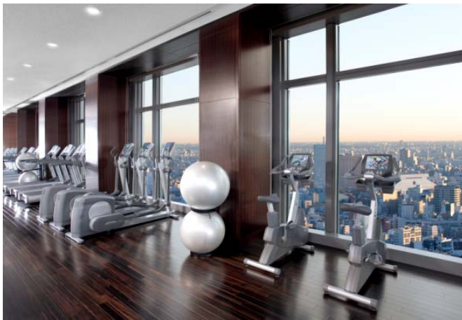
マンダリン オリエンタル 東京 38階 「フィットネスセンター」