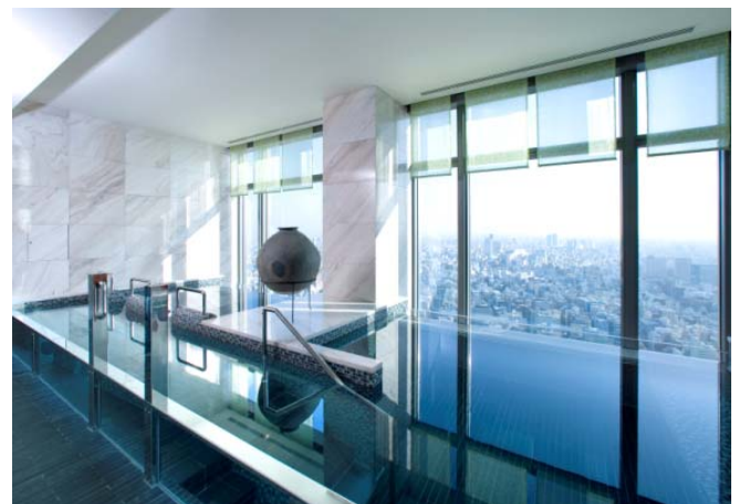
ザ・スパ・アット・マンダリン・オリエンタル・東京 37階 「ヒート&ウォーターエリア」